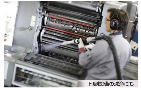
印刷設備の洗浄にも