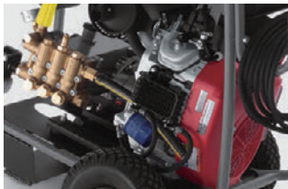
信頼のホンダ製エンジン

※1) 作業をしていない時にエンジンの回転を抑え、エンジンへの負荷を軽減することでトラブルを防ぎます。