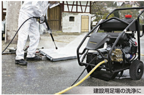
建設用足場の洗浄に