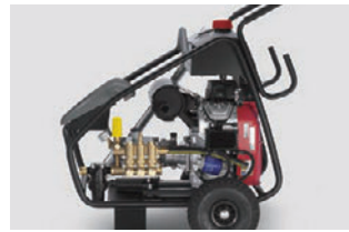
本体ユニットを守る頑丈なフレーム