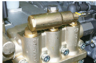
エンジン速度調整機能