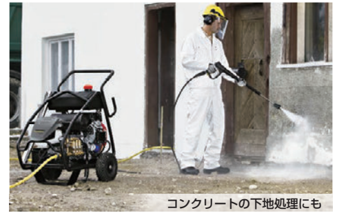
コンクリートの下地処理にも