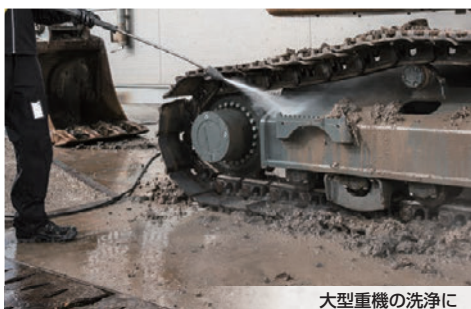
大型重機の洗浄に