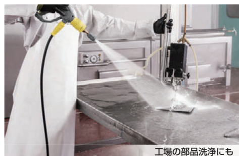
工場の部品洗浄にも