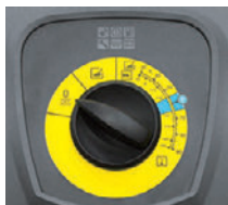
シンプル操作の大型ダイヤル

作業内容が一目で分かるイラスト入りダイヤルで、どなたでも操作できます。また、洗浄剤と燃料の補給口が大きく、液ダレを防ぎ床を汚しません。