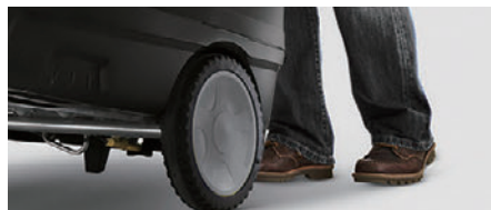
スムーズに移動できる大型タイヤ

大型タイヤで広い清掃範囲をカバーします。持ちやすいハンドルのため取り回しも容易です。また、コンパクトなため省スペースで設置できます。