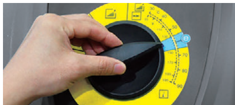
低燃費で環境にもやさしいエコモード搭載

エコモード機能により、一定の温度を保つことで燃料を節約し、清掃コストを抑えることができます。