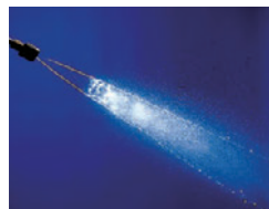
強力な水圧で清掃効率が向上

パワーノズルは、ムラのない強力な水圧で作業効率を高めま。ボイラーはステンレス製のヒートコイルを採用。安定した温水を供給します。