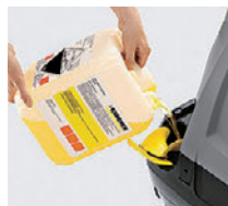
ガイド付の大型補給口